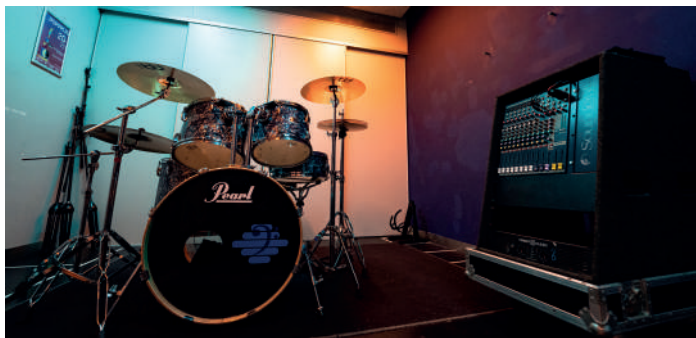
Oefenruimte 2 / Antoine Julien