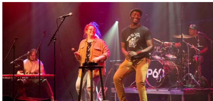
Vivid Sessions/ Paul Gabel