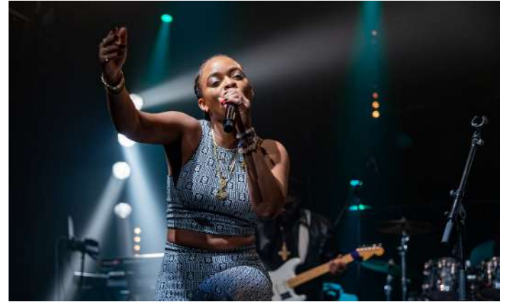
Lila Iké