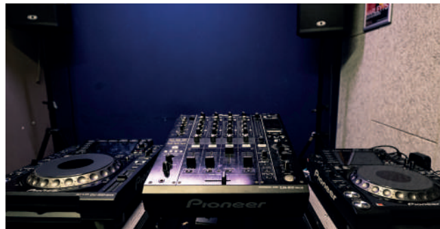
Oefenruimte 3 / Antoine Julien