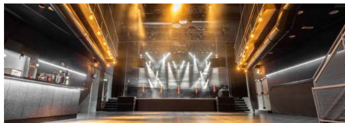
P60 Zaal / Dion Plasmeijer