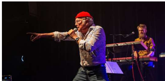
Drukwerk / Marc van der Maas

Wij zijn dan ook blij te horen dat de gemeente zeer tevreden is met de bijdrage die P60 levert aan cultuur, innovatie en samenwerking met andere cultuurinstellingen in Amstelveen.