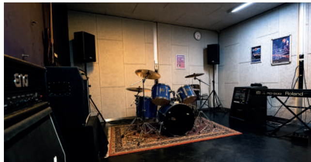
Oefenruimte 1 / Antoine Julien

Veel bands en dj's gebruiken P60 als hun vaste oefenruimte. Deze bands/acts treden ook met regelmaat op in P60 tijdens lokale talent avonden.