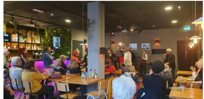
My Generation Cultuurcafé