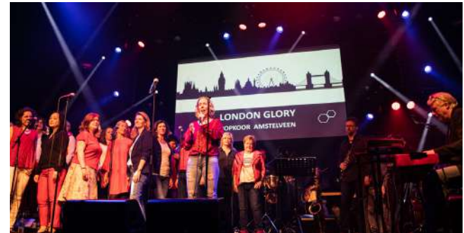
Popkoor Amstelveen / Antoine Julien