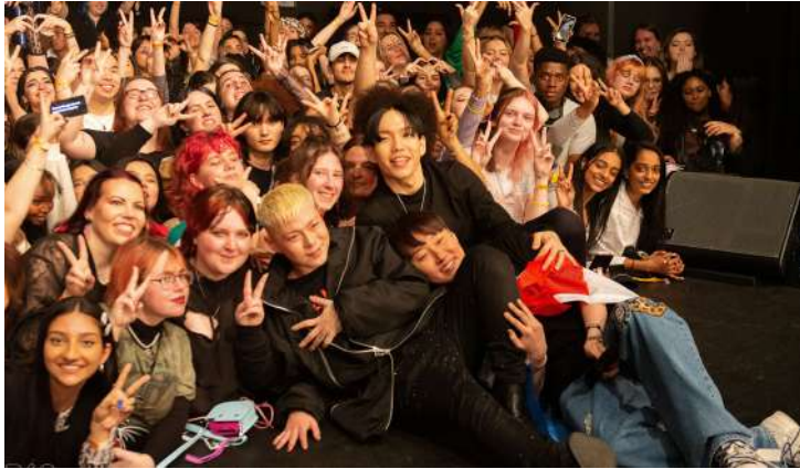
GSOUL / Marc van der Maas