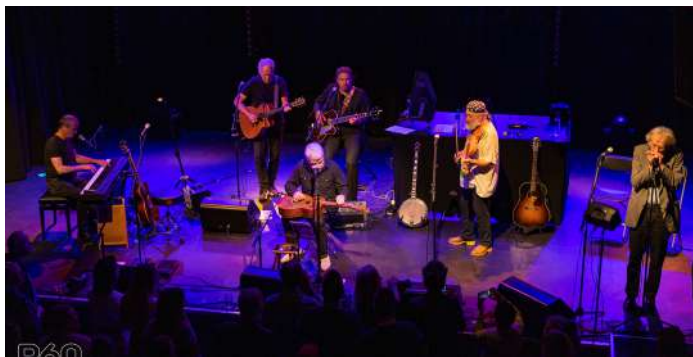
CCC Inc / Christophe Vico

Inclusief de 9.464 mensen van het (eet)café en de 1.015 bezoekers van de besloten verhuur, kwamen er 33.158 bezoekers naar P60. Dat is vrijwel gelijk aan het bezoekersaantal van 2019 en uiteraard veel meer dan in 2020 en 2021.