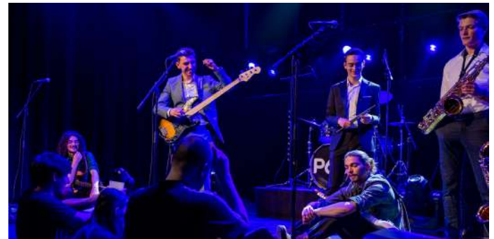
Popprijs 2022 Het Verbandt/ Christophe Vico