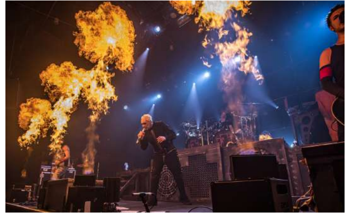
Feuerengel / Paul Gabel