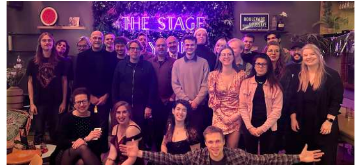
Kerstfeest 2022 met P60 team