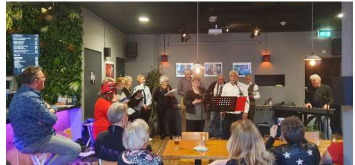
My Generation Cultuurcafé

Ook in 2022 was het P60 café op de woensdagen de plek voor de Bewoners Initiatief Groep van het Stadshart. Ze organiseerden op woensdag een koffieochtend en in de middag werd enthousiast gekaart. In 2023 komt daar de dinsdagochtend als extra dag bij.