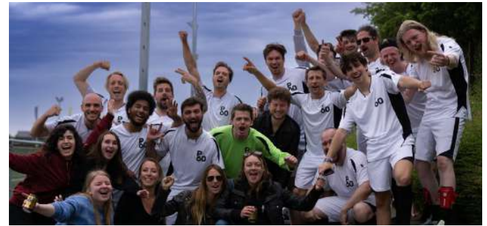
NK Poppodia voetbal 2022