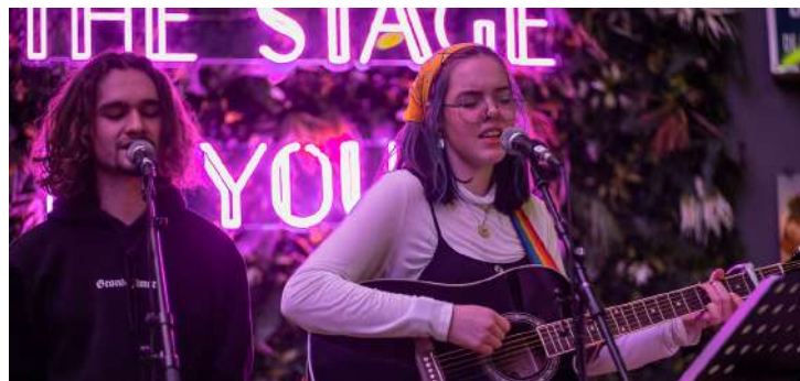
P60 Plug Uit: Yellow Green

We zagen een terugloop van het aantal bands, tijdens corona heeft dit op een laag pitje gestaan. We zijn heel blij dat we nu weer een toename konden zien. We maken hier graag ruimte voor in onze programmering.