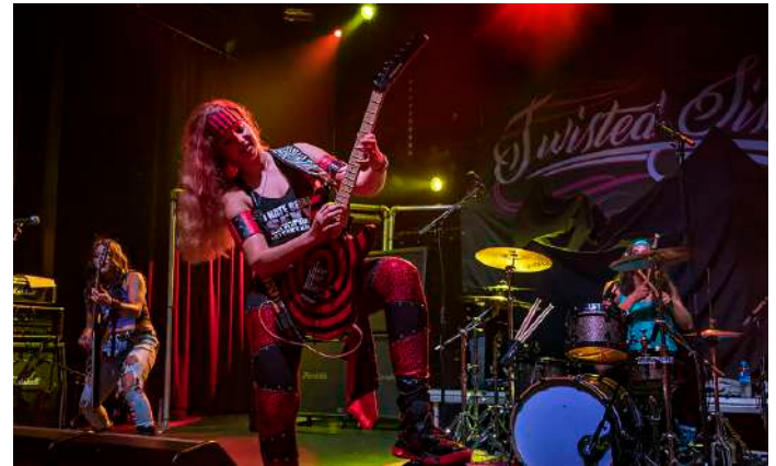
Twisted Sisters / Frans van Arkel